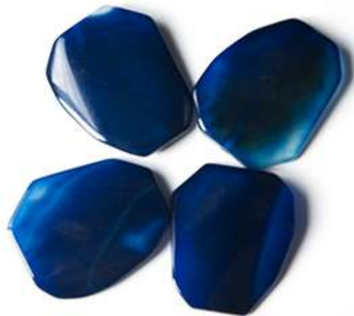
Ágata Azul 40 x 30mm