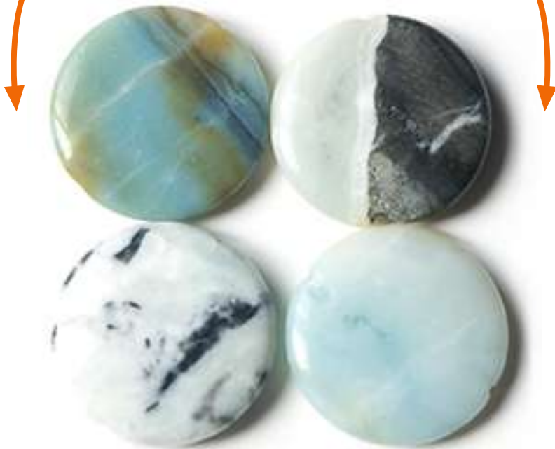
Amazonita 30mm Ø

de esta piedra sólo nos queda un colgante y un anillo en oro viejo