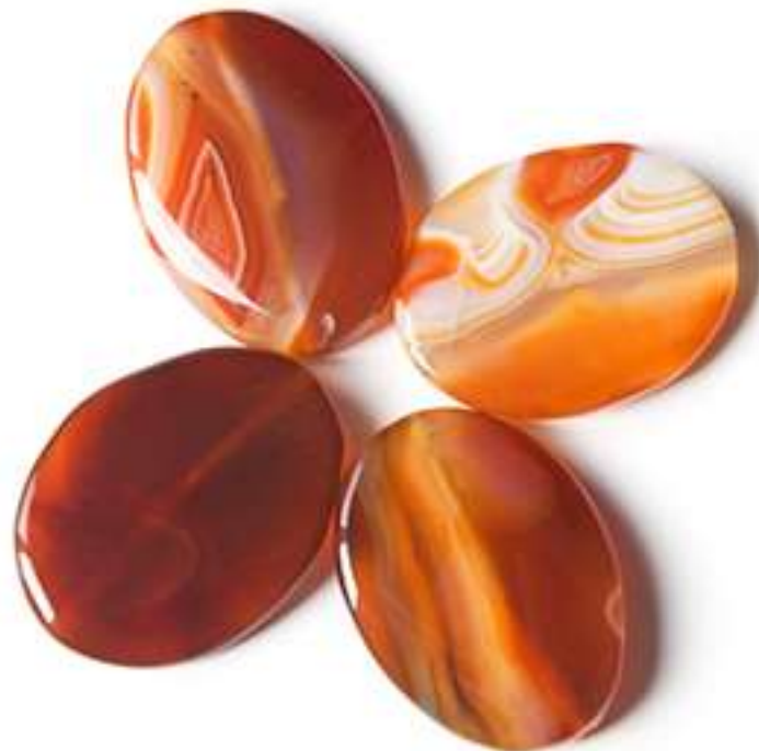
Ágata naranja/marrón 35x25mm